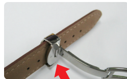
ベルト調整完了です