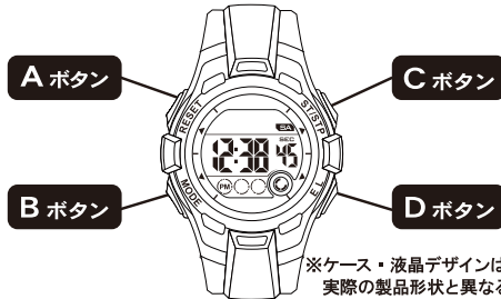
※ケース・液晶デザインは一例です。実際の製品形状と異なる場合があります。

●本説明書に出てくる各ボタンは、下の図を参照してください。 ●文字のデザインや色はモデルによって異なります。また、モデルにより多少機能が異なる場合があります。